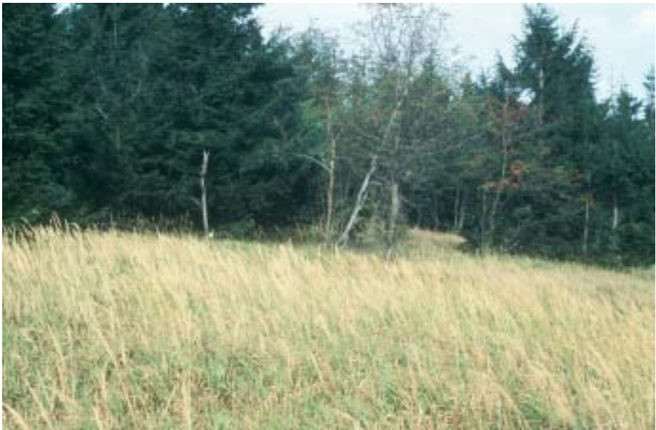
Abb. 3. Flächige Versteppung mit Calamagrostis villosa am Südhang. Steppic area with Calama grostis villosa on the south slope.