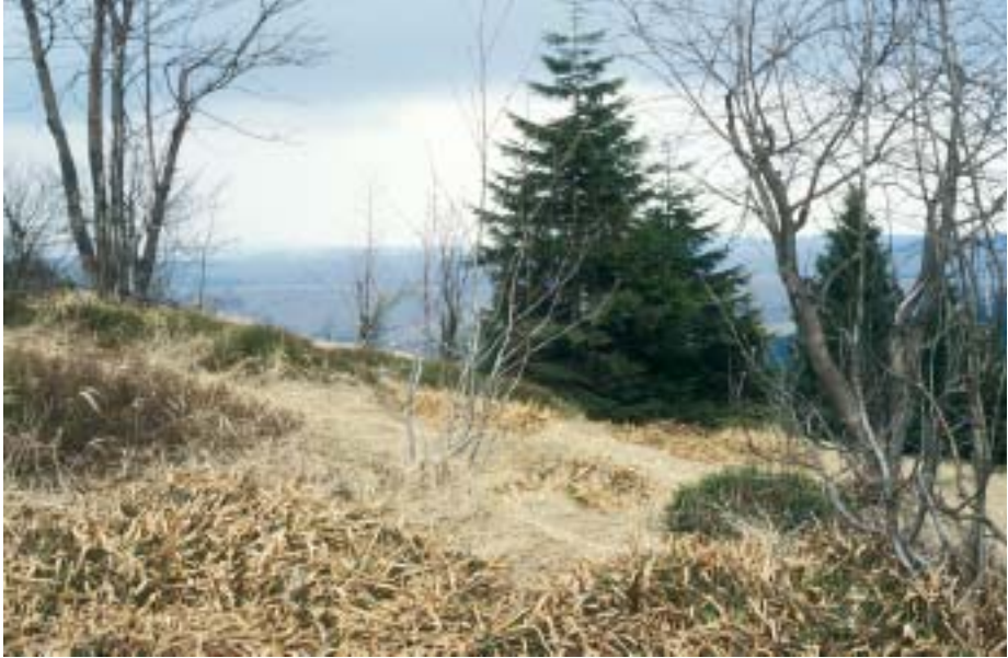
Abb. 2. Reich strukturierter Kreuzotterlebensraum der hochmontanen Stufe des Fichtelberges. Structurally diverse adder habitat in the high-montane level of the Fichtelberg.